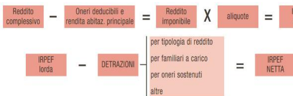
Tabella degli scaglioni e aliquote Irpef 2011

Schema di calcolo della tassazione Irpef annua sui redditi complessivamente percepiti: